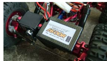
小型リポバッテリーNO-HLP16Rがオススメです。

フロントサーボ&バッテリープレートは、先にサーボステーを取付けた後、フロントギヤボックスとプレートの上に、アルミスペーサーを4つ挟み、3×15皿ビスで固定してください。メインシャーシは、4本のタワーバーで固定してください。