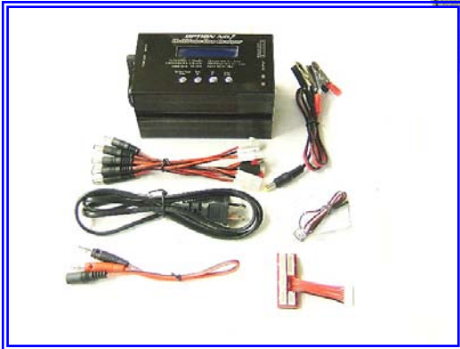
充電器下部に小型安定化電源を内蔵